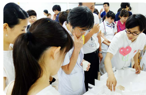
職員と作り手が一緒に療養環境について考えるイベント 「アートカフェ」/ 筑波メディカルセンター病院 (2012-)

医療・福祉現場でのアートやデザインのあり方や環境改善の方法について、みんなで考え、学びあえる場やプラットフォームを作ります。これまで、「アートカフェ」「病院のアートを育てるために」などのシンポジウムやツアーを実施しました。