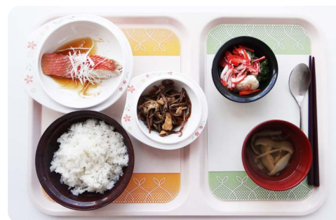
入院中の食事を美味しく楽しいものに改善するための 「滑り止めトレイシート」/ 筑波メディカルセンター病院 (2008)

療養生活を支援するための製品、家具、プログラムの開発・販売を行います。この滑り止めトレイシートは食事を鮮やかに引き立てつつ、認知症の方がご飯に集中出来るように配慮されています。摂食・嚥下を専門とする病院職員と一緒に開発しました。