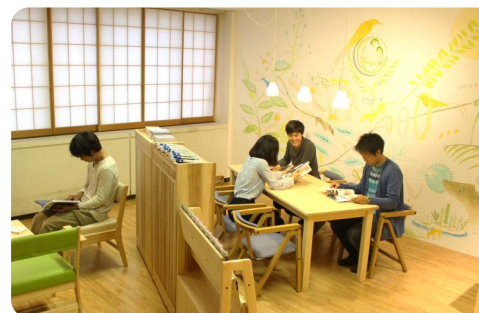
病室の一室を患者さんの居場所として改修した患者図書室 「桐の葉文庫」/ 筑波大学附属病院 (2015)

環境の特徴や課題を診断し、改修やデザイン、アートによる改善を行います。「桐の葉文庫」は、気分転換できる居場所が少ない病院で、患者さんが病室を離れ、落ち着いた時間を過ごせるように作りました。生命力や五感に訴える家具や壁画を設えました。